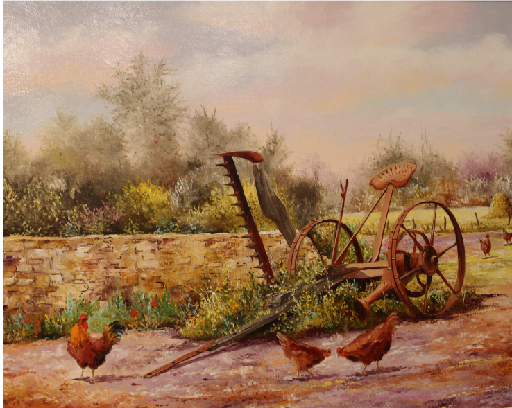
« La faucheuse » - Jean-Pierre EMERY - Lauréat Salon Serquigny 2012