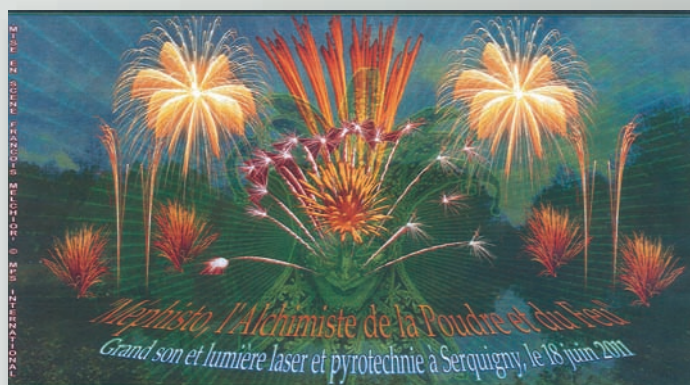
Spectacle « son et lumière » du 18 juin 2011