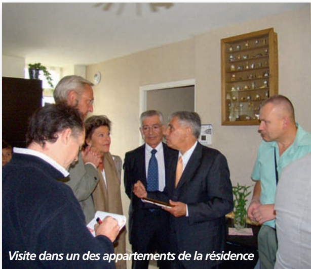
Visite dans un des appartements de la résidence