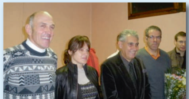
Monsieur le Maire en compagnie du Président et des licenciés du club