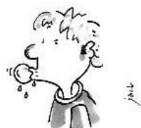
Ne pas mâcher de chewing-gum