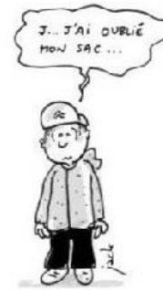
Avoir son matériel