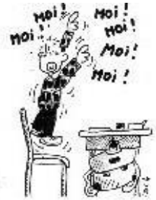
Ne pas couper la parole