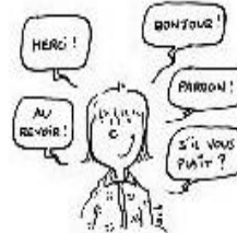
Être poli et utiliser les mots magiques