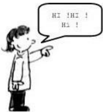
Ne pas se moquer