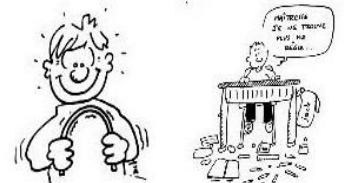
Prendre soin du matériel