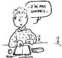
Poser des questions si on n'a pas compris