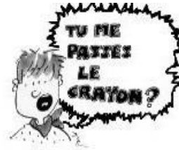
Ne pas parler fort