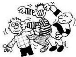
Ne pas se bagarrer