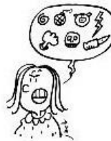
Ne pas dire de « gros mots »