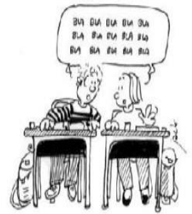
Ne pas bavarder