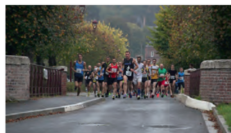
Le peloton peu après le départ

Prochaine édition, dimanche 11 octobre 2015.