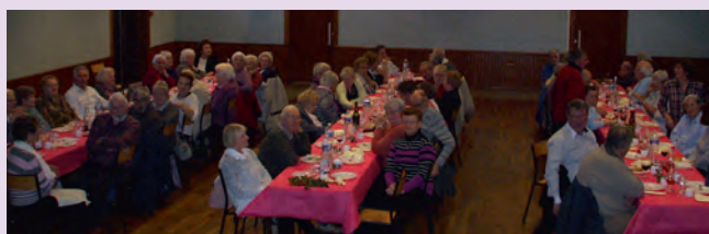
L'UNRPA réuni pour fêter l'arrivée du « Beaujolais Nouveau »

Toutes les personnes qui souhaitent rejoindre le club sont les bienvenus.