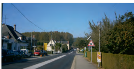
Réfection de la chaussée et des trottoirs dans le secteur du garage Renault