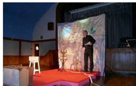
Lecture-spectacle à la salle des fêtes le témoignage bouleversant d'une femme qui raconte comment elle a vécu sa guerre 14-18