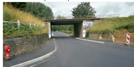
Réfection du revêtement de la chaussée et des trottoirs