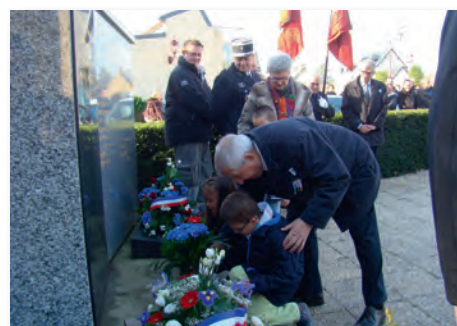
Dépôt de gerbes par les enfants des écoles