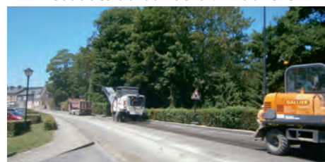
Grattage de l'ancien revêtement