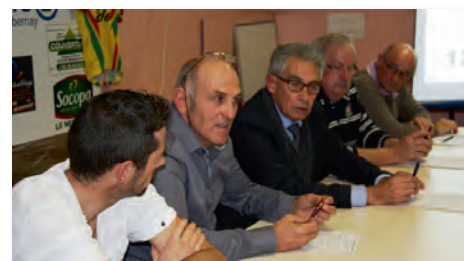
Assemblée générale du club