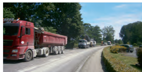
Début des travaux de la 3 ème tranche

Ces travaux indispensables permettent aujourd'hui une meilleure circulation des 7 000 véhicules quotidien, favorisent le cheminement piétonnier et assurent un stationnement en conformité avec les règles de circulation.