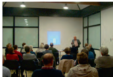
Conférence sur l'Artisanat des tranchées

La cérémonie prit fin sur un lâcher de ballons de couleur bleu, blanc, rouge, symbolique, signe de paix et de liberté.