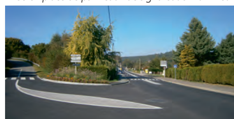
Carrefour près du pont de la Glacière