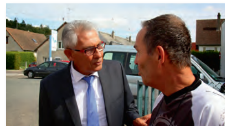
Monsieur Le Maire venu encourager les coureurs