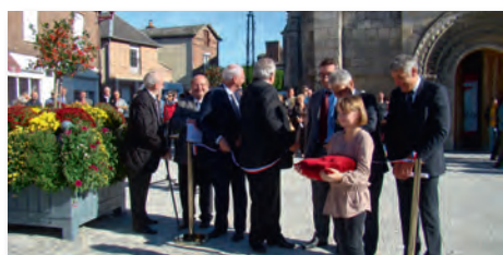
Inauguration le samedi 18 octobre 2014