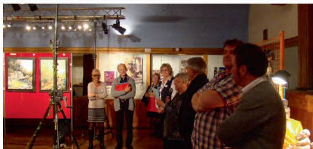
Remise des prix à la clôture du salon