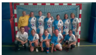
L'équipe Séniors A Féminine

Samedi 5 septembre : Assemblée Générale de l'AS Carsix (salle des fêtes de Serquigny)