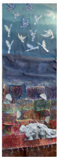
Fresque réalisée par les enfants des écoles