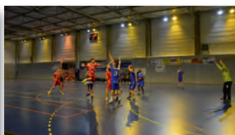
L'équipe Sénior A Masculine 2 ème tour de la coupe de france