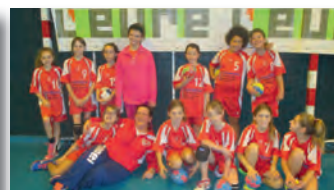
Les moins de 11 ans filles en tournoi à Gravigny