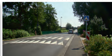
Ralentisseur au pont du lavoir