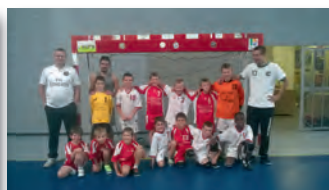
Les moins de 11 ans garçons