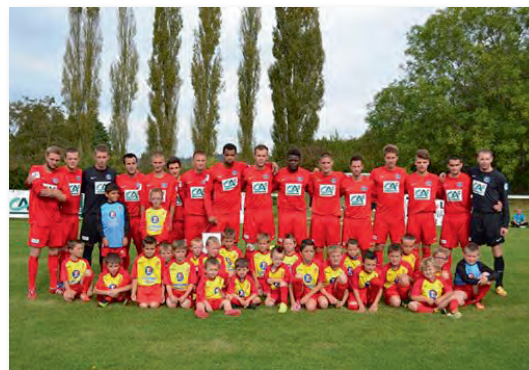
L'équipe Sénior A le 28 septembre 2014 4 ème tour de la coupe de France

Souhaitons au FCSN d'atteindre leurs objectifs et venez les encourager lors de leurs rencontres sur les terrains de Serquigny ou de Nassandres.