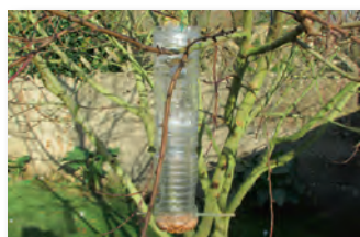
Mangeoires réalisées en atelier périscolaire

Un espace dédié à cet effet leur a été réservé près du centre aéré. Il a déjà permis :