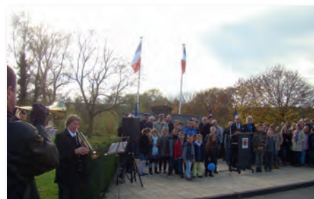
Des musiciens pour accompagner les adultes et les enfants