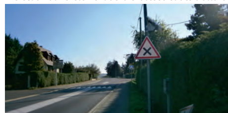
Mise en place de panneaux de signalisation lumineux