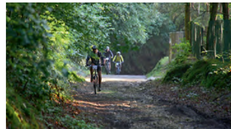
Passage en sous-bois

Objectifs route 2015 : les courses départementales, les championnats de l'Eure, Normandie, France FFC et UFOLEP, les cyclosporives, l'étape du tour à St Jean de Maurienne, les challenges UFOLEP.