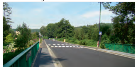
Réfection du revêtement de la chaussée et des trottoirs