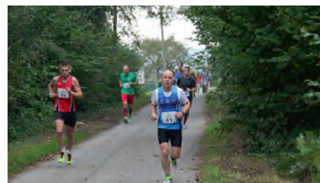
Le gagnant de la course maillot rouge