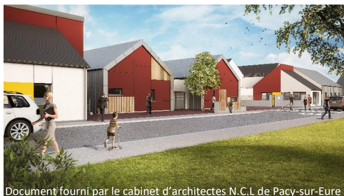
Document fourni par le cabinet d'architectes N.C.L de Pacy-sur-Eure

Tel : 06.82.31.32.84 - Email : petiteenfance@bernaynormandie.fr